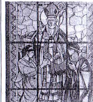
Il francobollo dedicato al Santo